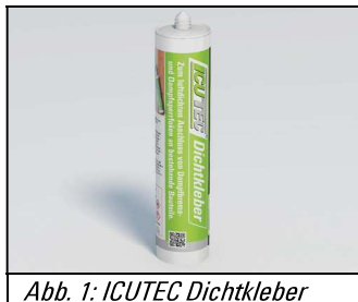
Abb. 1: ICUTEC Dichtkleber