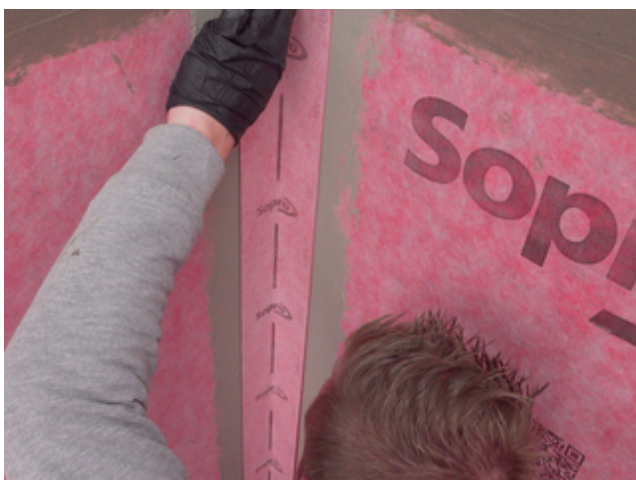
11 Das passgenau zugeschnittene Sopro AEB® Dichtband Flex (mit Falz) ohne Schlaufenbildung in die frische Klebeschicht einlegen und fest andrücken.