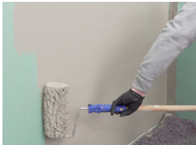
5 Für ein gleichmäßig deckendes Ergebnis Sopro Fixier- & DichtKleber oder Sopro DichtSchlämme Flex RS im Kreuzgang auftragen.