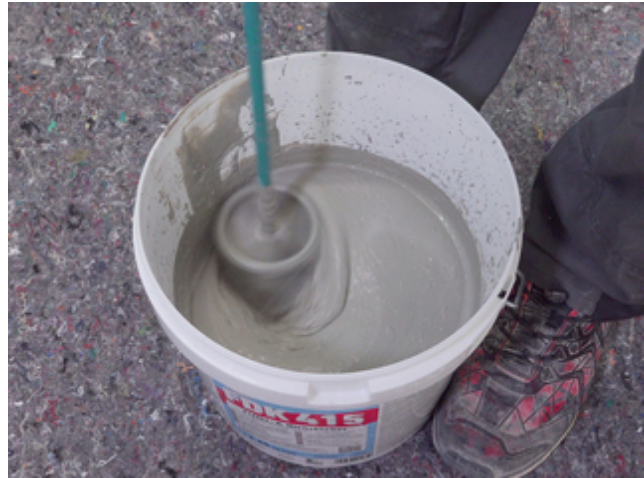
2 FDK 415: Flüssigkomponente vorgeben und mit Pulverkomponente maschinell anmischen. Alternativ: DSF RS im vorgegebenen Verhältnis mit Wasser anrühren.