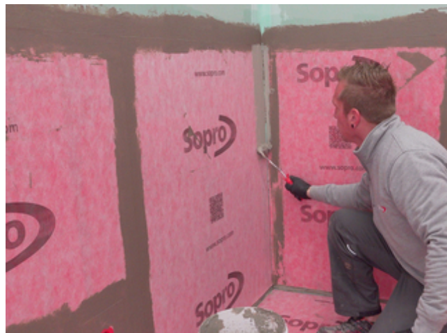
10 Stoßbereiche der Sopro AEB® Abdichtungs- und EntkopplungsBahn werden mit Sopro AEB® Dichtband Flex (mit Falz) überarbeitet.