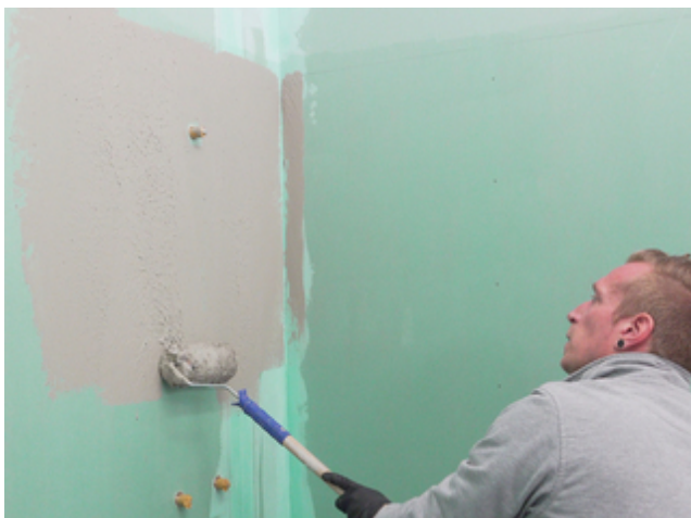
4 Sopro Fixier- & DichtKleber oder Sopro DichtSchlämme Flex RS vollflächig aufrollen.