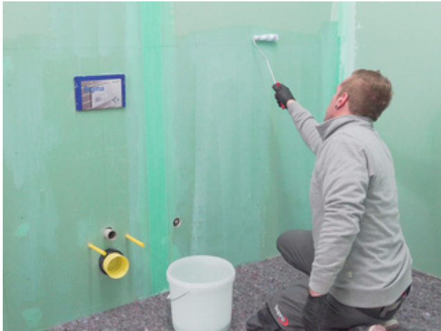
1 Saugende Untergründe mit Sopro Grundierung vorbehandeln.