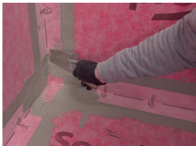
12 Abschlüsse des AEB® Dichtband Flex (mit Falz) werden im Anschluss mit Sopro Fixier- & DichtKleber oder Sopro DichtSchlämme Flex RS überarbeitet.