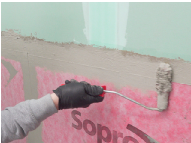
9 Die Abschlüsse der Sopro AEB® Abdichtungs- und EntkopplungsBahn mit Sopro Fixier- & DichtKleber oder Sopro DichtSchlämme Flex RS überarbeiten.