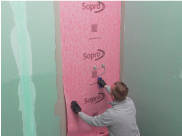
7 Die passgenau zugeschnittene Sopro AEB® Abdichtungs- und EntkopplungsBahn in die frische Klebeschicht einlegen und von der Mitte her fest andrücken.