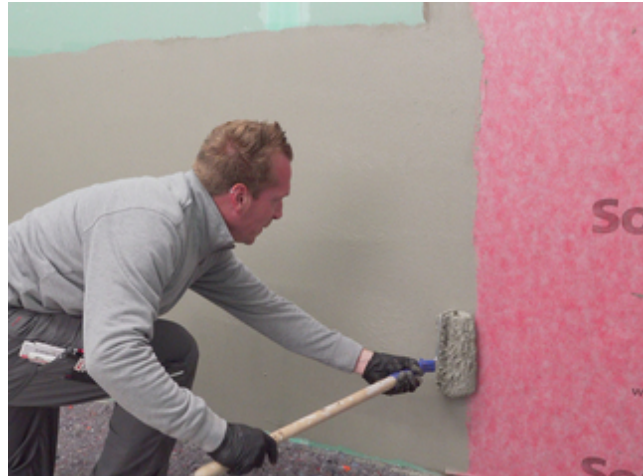
8 Die Überlappungen der Sopro Abdichtungs- und EntkopplungsBahn ca. 5 cm mit Sopro Fixier- & DichtKleber oder Sopro DichtSchlämme Flex RS überarbeiten.