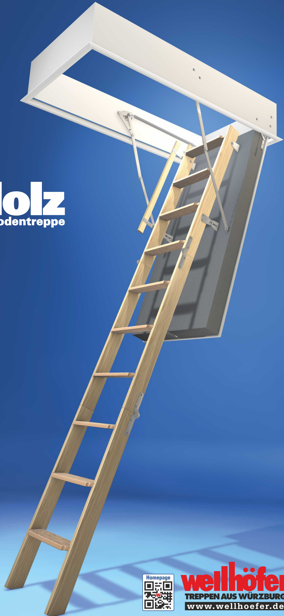
Abbildung zeigt Bodentreppe GutHolz mit Wärmeschutz WS4D und Handlauf